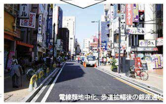
図 交通社会実験を実施し整備を行った例