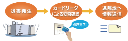
図 BCP 対応入退室管理システム

非常時に自治体職員がやることは山ほどあります、自動化できるところはアズビルにお任せいただき、人的対応の必要な業務に専念してください。