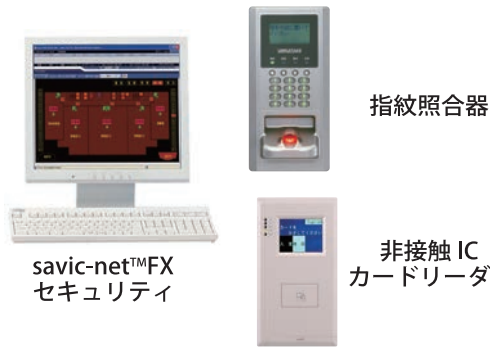
図 アズビルの入退室管理機器

国内で多くの実績を誇るアズビルの施設入退室管理セキュリティシステムを導入すれば、施設の統合化、多機能化もスマートにできます。また庁舎等では職員の出退勤管理にも応用でき働き方改革にも貢献できます。