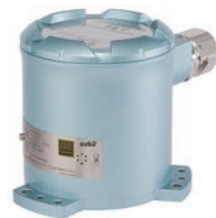
図 インテリジェント地震計