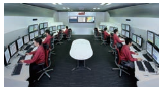
図 アズビルBOSSセンター

アズビルは我が国トップの施設監視システム納入実績と豊富な施設管理の経験で公共施設の効率的運営、維持管理費の削減を実現してまいりました。そして行政施設の維持管理をIT技術でアウトソーシングするサービスも行っています。各行政の建物と弊社BOSSセンターを通信回線で結び、24時間・365日の遠隔監視・制御を実施。あわせて、各地のデポセンターでは、建物設備に精通した技術者が巡回点検を実施し、緊急の問題にも迅速に対応しています。高度な技術とサービスで、高品質の施設管理を行いながら、自治体の資産経営の支援とライフサイクルコストの低減をお約束します。