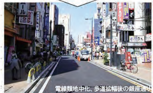
図 交通社会実験を実施し整備を行った例